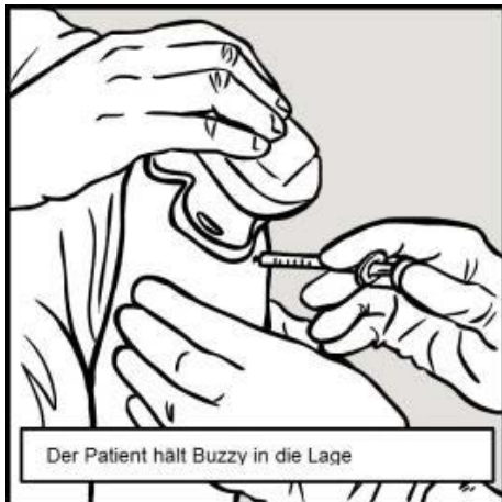
Der Patient hält Buzzy in die Lage