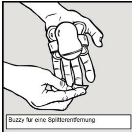
Buzzy für eine Splitterentfernung