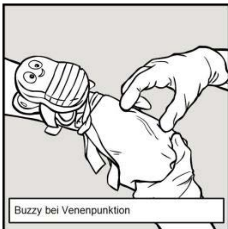
Buzzy bei Venenpunktion