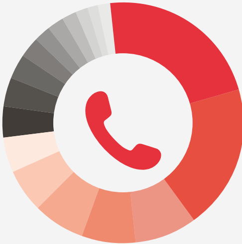
Gesprächsinhalte – Telefon

Das Total aller Kontakte (17 723) liegt 2021 leicht niedriger als im Ausnahmejahr 2020, bleibt jedoch deutlich höher als noch 2019.