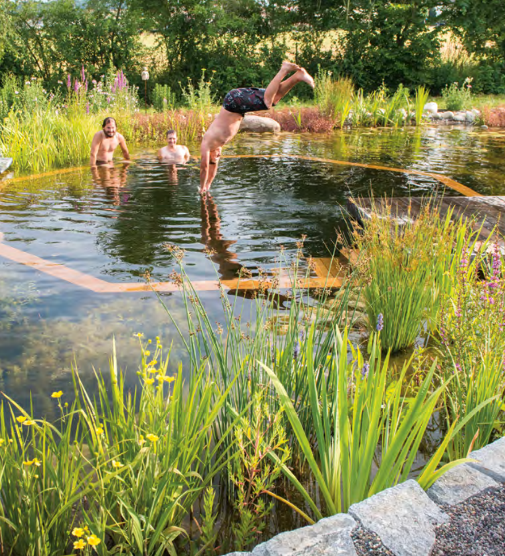
Schwimmteiche oder Naturpools fördern die Lebensvielfalt im Siedlungsraum.