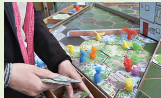
BioDio-Informationsspiel im Einsatz.

Wir konnten das neue Ausstellungsmodul «BioDio» für unsere Sektionen realisieren und die Kosten vollständig mit Sponsoringbeiträgen decken. Wie jedes Jahr konnten wir auch 2016 ein attraktives Exkursionsprogramm «Vielfältige Lebensräume» zusammenstellen, das Dank der Partnerschaft mit der Aargauer Kantonalbank unser Budget nicht belastete. Auf acht gut besuchten Exkursionen wurde eindrücklich die Vielfalt der Lebensräume im Aargau gezeigt. Einen herzlichen Dank geht an die Vereine, die einen Anlass beige-steuert haben. Mit zwei kreativen Versänden an die Spender festigten wir die