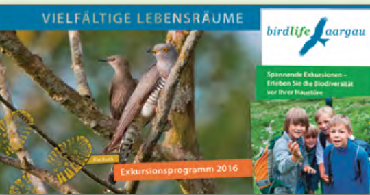
Titelseite Exkursionsprogramm 2016.

Beziehungen weiter und konnten das Spendenaufkommen halten. Für unsere Partner und Grossspender organisierten wir als Dank einen Anlass in unserem grössten Reservat Eriwis mit Apéro. Unsere informative und attraktive Verbandszeitschrift «Milan» beleuchtete das Schwerpunktthema «Natur im Siedlungsraum» von verschiedenen Seiten. Mittels Milan, Newsletter und unserer attraktiven Webseite informieren wir regelmässig über Aktualitäten im Natur- und Vogelschutz. Seit 2016 sind wir auch aktiv auf Facebook.