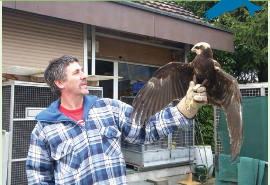
Seltener Pflegling – eine Rohrweihe.