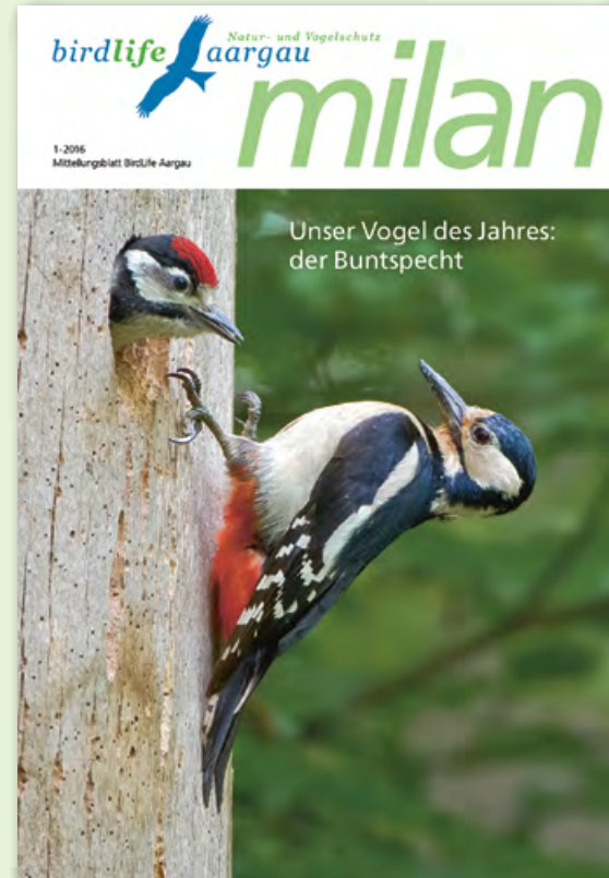
Milan-Titelseite mit dem Vogel des Jahres 2016.