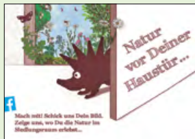
Aktiv in sozialen Netzwerken: BirdLife Aargau auf Facebook.

Beziehungen weiter und konnten das Spendenaufkommen halten. Für unsere Partner und Grossspender organisierten wir als Dank einen Anlass in unserem grössten Reservat Eriwis mit Apéro. Unsere informative und attraktive Verbandszeitschrift «Milan» beleuchtete das Schwerpunktthema «Natur im Siedlungsraum» von verschiedenen Seiten. Mittels Milan, Newsletter und unserer attraktiven Webseite informieren wir regelmässig über Aktualitäten im Natur- und Vogelschutz. Seit 2016 sind wir auch aktiv auf Facebook.