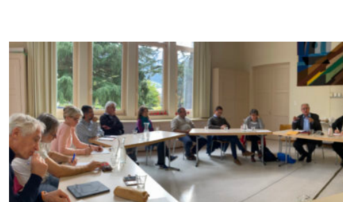
Le goût et la saveur