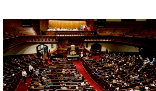
Église du passé composé, Église du futur antérieur